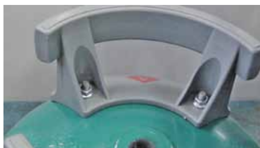
2 dei 4 dadi avvitati sulla bombola gas

Assemblare in maniera semiautomatica impugnature in plastica su bombole gas mediante 4 dadi M8 con rondella incorporata alla coppia di 15 Nm.