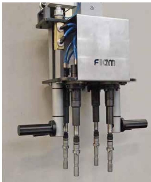
Multiplo di avvitatura