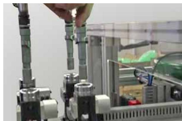
Momento del prelievo dei 4 dadi dalla stazione di pescaggio