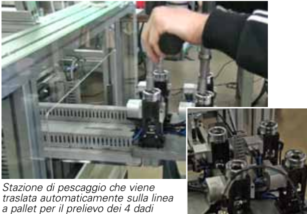
Stazione di pescaggio che viene traslata automaticamente sulla linea a pallet per il prelievo dei 4 dadi